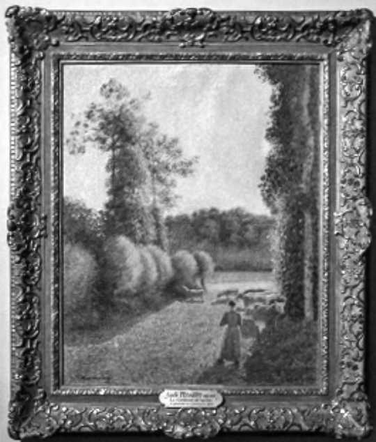
Joh. Rindfleisch Landschaft mit Wasser