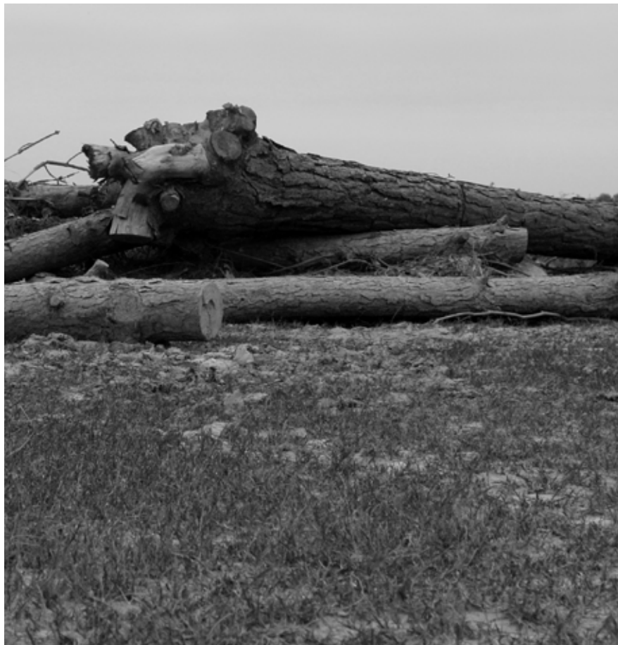
Maximiliano Peralta Rodríguez, Márgenes de acción (detalle del video), 2015, video-instalación.