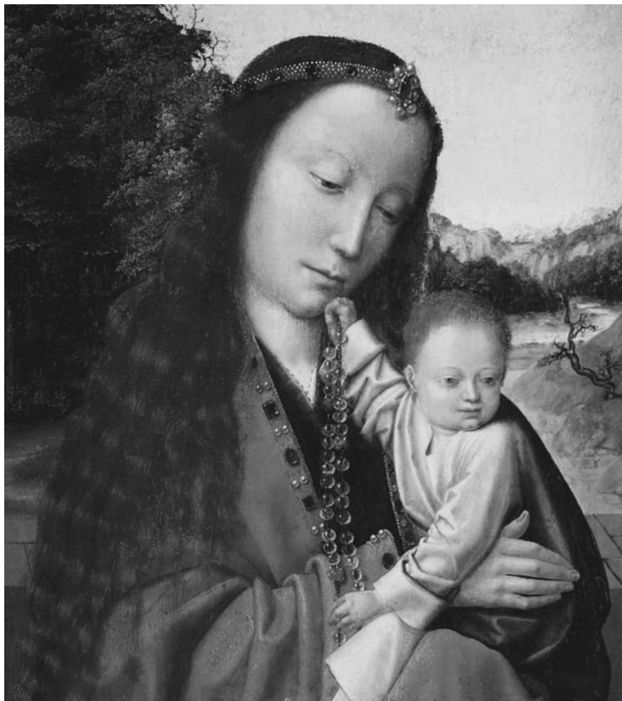
Atribuido a Gerard David, La Virgen y el Niño Jesús (detalle), óleo sobre tabla, 37 x 26 cm, donación familia Castagnino