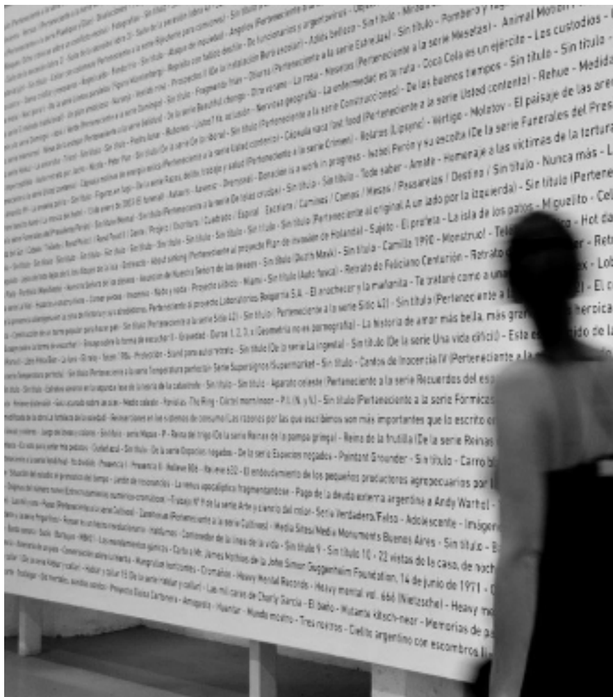
Ediciones digitales #5, Construcción de un museo